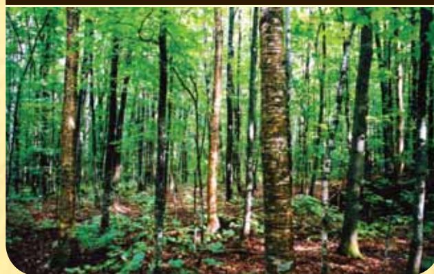
Peuplement feuillu de structure régulière

Forêt issue d'une perturbation. Les arbres ont le même âge.