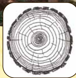
Croissance en diamètre favorisée