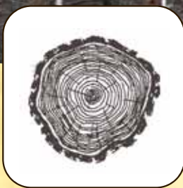
Croissance en diamètre limitée