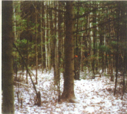
Au moment de l'éclaircie, les tiges qui nuisent à la croissance des arbres d'avenir sont récoltées. Elles sont identifiées avant la coupe avec de la peinture ou des rubans.