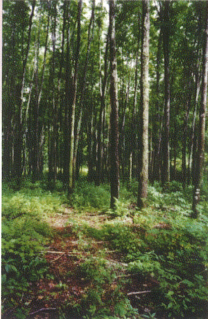
Les arbres d'avenir doivent être en bonne santé, avoir une tige droite et une cime bien développée.

Le but fondamental de l'éclaircie commerciale est d'orienter la sélection naturelle des arbres vers les plus vigoureux. Vous devez donc choisir les arbres les plus sains et les plus droits, dont la cime est assez développée pour réagir au traitement sylvicole. On les appelle les arbres d'avenir. Vos choix doivent aussi se porter sur les espèces d'arbres désirées par le marché du sciage, puisque l'éclaircie vise aussi à améliorer la qualité du bois.