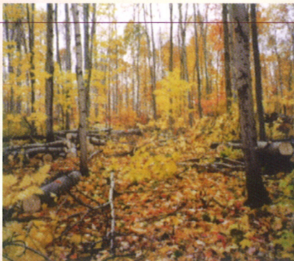
Avec plusieurs sentiers de débardage, il est plus simple de sortir le bois coupé sans blesser les tiges qui demeurent sur pied.