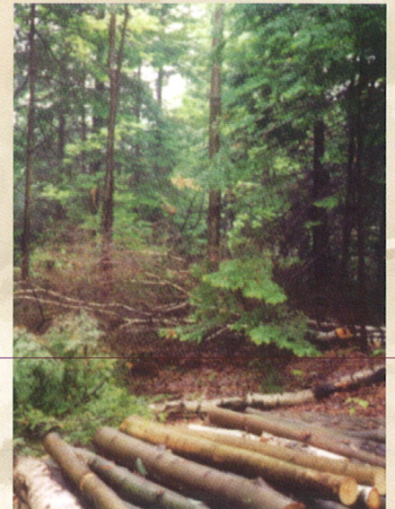
Éclaircie commerciale dans une forêt mélangée.

Sylviculture d'un boisé privé , 1989. OPBRQ, CERFO.