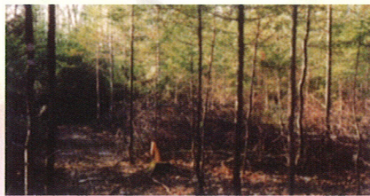
Éclaircie précommerciale réalisée dans une jeune forêt de résineux.

Des tableaux déterminant les distances à conserver entre chaque arbre d'avenir peuvent vous aider lors de l'éclaircie. Ces distances varient selon les espèces d'arbres. Les résineux doivent être éclaircis en coupant tout ce qui pousse dans un rayon de 1 mètre (3,3 pi) autour de la tige.