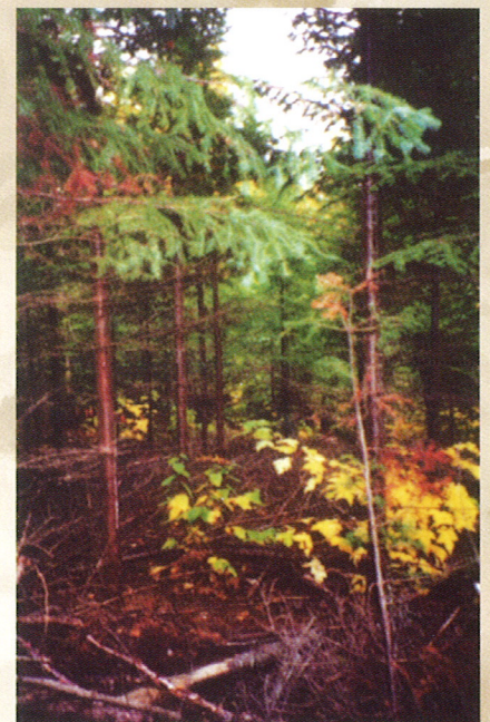
Éclaircie précommerciale réalisée dans une forêt de résineux.

Sylviculture d'un boisé privé , 1989. OPBRQ, CERFO.