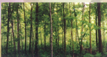
Éclaircie précommerciale réalisée dans une forêt de feuillus.

Quant aux feuillus, il faut également dégager les cimes des arbres d'avenir sur un rayon de 0,5 à 1 mètre (1,6 à 3,3 pi) autour de celle-ci. Toute végétation qui ne nuit pas aux cimes doit être laissée sur pied afin d'éviter qu'il y ait trop de lumière sur les troncs. En effet, plusieurs feuillus