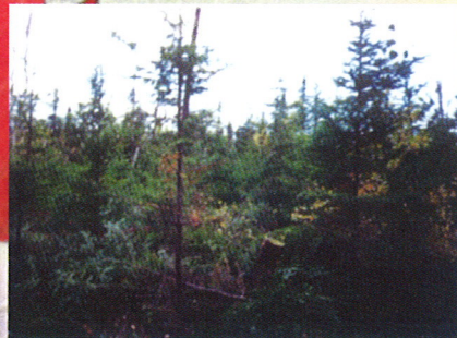
Les arbres coupés lors de l'éclaircie sont laissés au sol.

L'éclaircie précommerciale est une coupe qui permet de réduire la densité des jeunes boisés dont les arbres sont trop serrés. Il s'agit de sélectionner les meilleurs individus, pour ensuite supprimer les arbres voisins pouvant nuire à leur croissance. Donc, au lieu d'attendre que les arbres les plus forts suppriment les plus faibles naturellement, vous choisissez les individus qui composeront votre future forêt et vous coupez les autres. Cette éclaircie est dite précommerciale, car les arbres abattus sont trop petits pour en faire la mise en marché. Ceux-ci sont donc laissés au sol après l'opération.