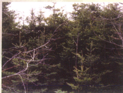
Dans cette forêt de résineux, la lutte entre les arbres pour obtenir l'accès à la lumière et l'espace est très élevée.

L'éclaircie précommerciale est réalisée dans les jeunes forêts âgées généralement de 10 à 20 ans et qui sont trop denses. Une forêt est trop dense lorsque les branches d'arbres voisins s'entrecroisent, de sorte que la compétition pour obtenir l'accès au soleil et à l'air devient beaucoup trop élevée.