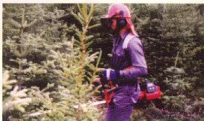
Le respect des règles de sécurité et d'entretien de son outil de travail est essentiel lors des travaux.

Il est important d'être prudent pendant les opérations et de savoir manipuler correctement son outil de travail, car les obstructions étant nombreuses, il est facile de se blesser.