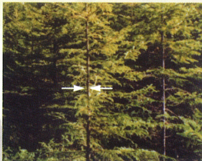
Pour réaliser une éclaircie précommerciale, le diamètre moyen des arbres doit être inférieur à 10 centimètres (4 po) et leur hauteur, environ supérieure à 2 mètres (6,5 pi). Source: OPBRQ

Avant d'être éclairci, le peuplement doit contenir un minimum de 5 000 tiges à l'hectare (2 000 tiges/acre). De plus, le diamètre moyen des tiges doit être inférieur à 10 centimètres (4 po) et leur hauteur, environ supérieure à 2 mètres (6,5 pi).